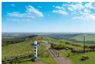
◆雄大な眺望を望める開陽台 (かいようだい)

「中標津町は北海道の東部・根室管内の中部に位置するまちです。ライダーの聖地と呼ばれるパノラスポット「開陽台」や、ジェットコースターのような「ミルクロード」の景観は北海道を実感できます。また道内でも特に酪農の盛んな地域のため乳製品も有名です。