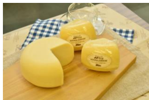
◆中標津産のチーズ