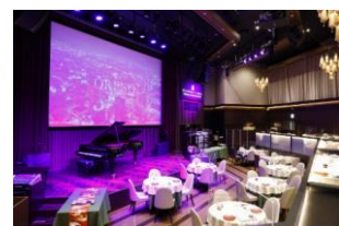
▲俺のフレンチグランメゾン大手町

詳しくはコチラ → 俺のフレンチグランメゾン大手町 & JAL「旅するメーカーズディナー」